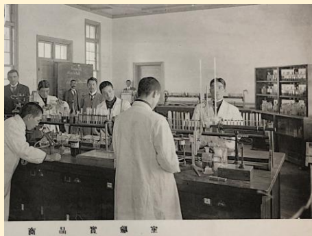
戦前の商品実験室 (卒業アルバム 1924)