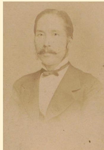
榎本武揚肖像